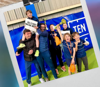
Nos jeunes en finale du trophée Caisse d'Epargne 28 mars 2026