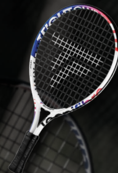
T-FIGHT CLUB 17