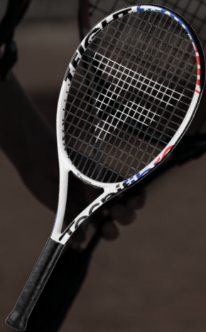
T-FIGHT TEAM 25