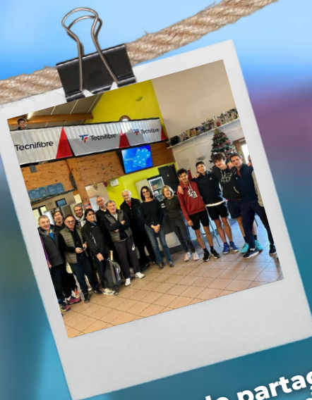
Moment de partage - Pôle Tennis Etudes et Séniors+ 16 décembre 2025