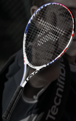
T-FIGHT CLUB 25 & 23

ABORDEZ VOTRE RENTRÉE CLUB EN TOUTE SÉRÉNITÉ