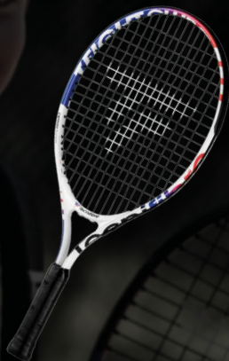
T-FIGHT CLUB 21 & 19