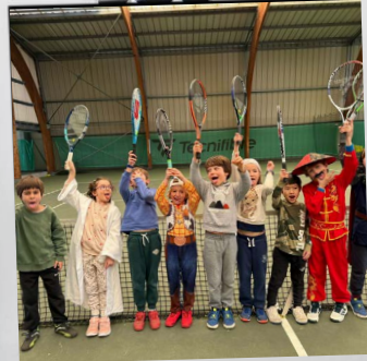
Animation Carnaval pour l'école de tennis 18 & 21 février 2026