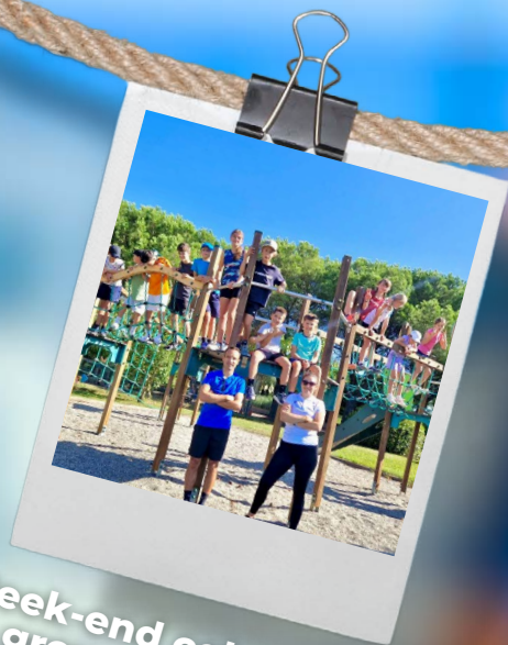
Week-end cohésion - groupe Elites & Compétitions 6-7 septembre 2025