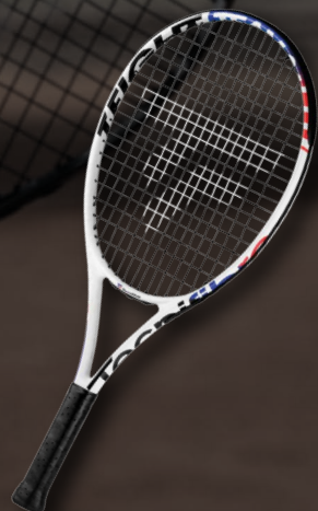
T-FIGHT TEAM 24