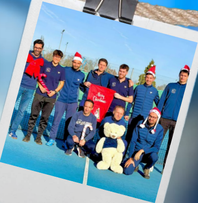
Noël au club 25 décembre 2025