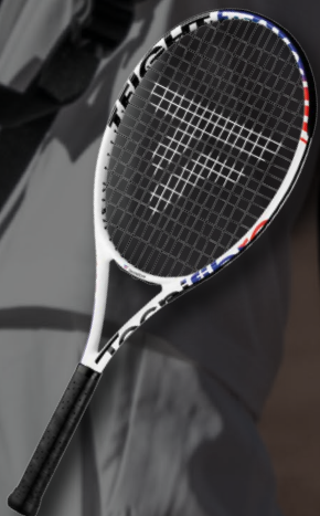
T-FIGHT TEAM 26