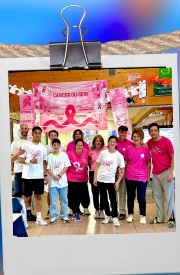
Animation Octobre Rose 26 octobre 2025